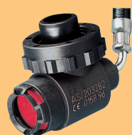
LA 96-AS D4075850