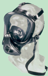
Ultra Elite D2056700

Pour application avec filtre, adduction d'air à pression normale, appareils respiratoires isolant et appareil a ventilation assistée.