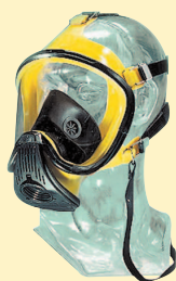
Ultra Elite-Silicone D2056718