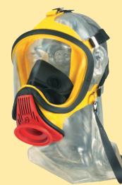
Ultra Elite-PS-MaXX-Silicone 10031384