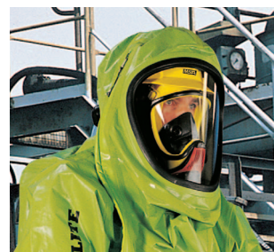
Parfait dans les scaphandres grâce a un désigne ergonomique