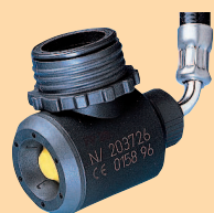
LA 96-N D4075852