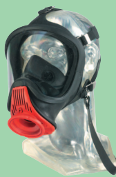
Ultra Elite-PS-MaXX 10031385