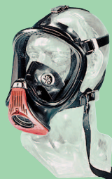
Ultra Elite-PF D2056741

Pour appareils respiratoire compatible avec Soupape à la demande à pression positive.