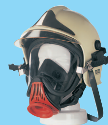
Ultra Elite-H-PS-MaXX-F1 10045899