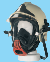
Ultra Elite-H-PF-F1 10045893