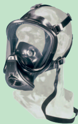
Ultra Elite avec transponder 10013876