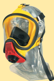
Ultra Elite-PS-Silicone D2056764

Masques complet. Pour appareil respiratoire isolant avec soupape à la demande à pression positive AutoMaXX.