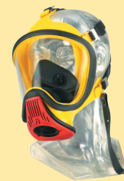
Ultra Elite-PF-Silicone D2056763