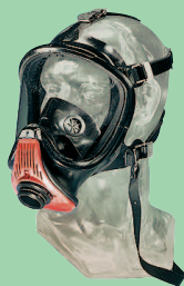
Ultra Elite-PS avec transponder 10026552