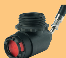
LA 96-AE D4075851