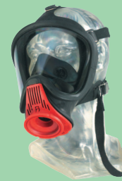
Ultra Elite-PS-MaXX-EZ 10031382