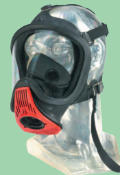
Ultra Elite-PF-EZ D2056771