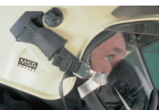
En exclusivité les brides rapides pour casques