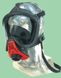
Ultra Elite-PS-EZ D2056772