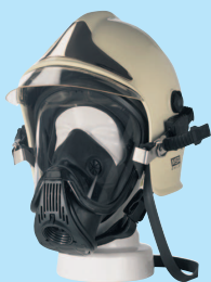
Ultra Elite-H-F1 10045891