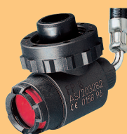
LA 88-AS D4075906