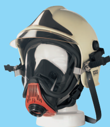
Ultra Elite-H-PS-F1 10045897