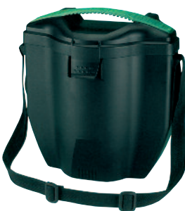
Boîte Avantage 3000