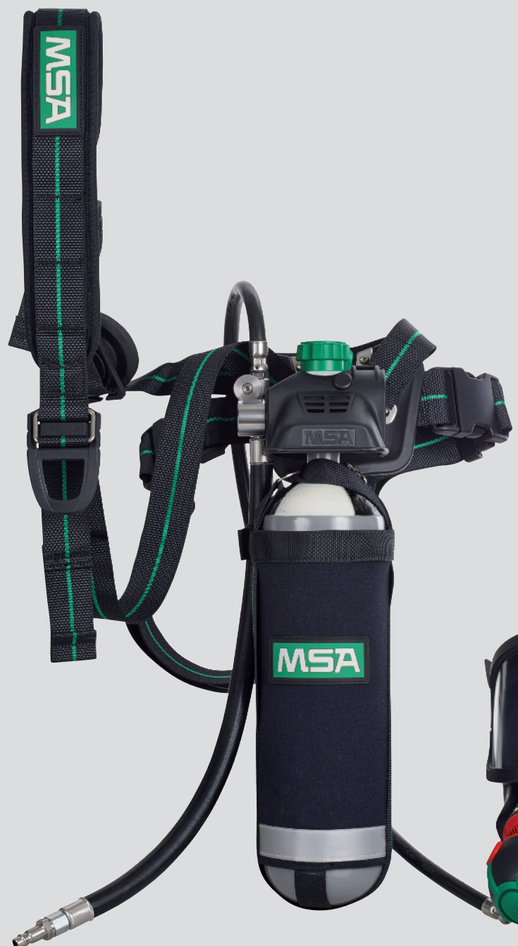
PremAire Combination avec 3S-PS-MaXX et AutoMaXX-AS