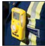
Simplicité de transport

Compatible avec les systèmes MicroDock II et IntelliDoX de gestion des instruments, le détecteur BW Clip est conçu pour respecter les normes les plus exigeants en termes de qualité et de fiabilité, afin de vous garantir sécurité et conformité.