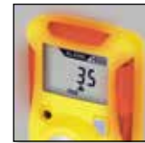
Simplicité de visualisation

Utilisez notre technologie avancée unique pour garantir sécurité, conformité et productivité.