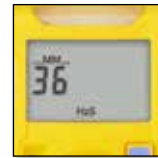
Simplicité de lecture